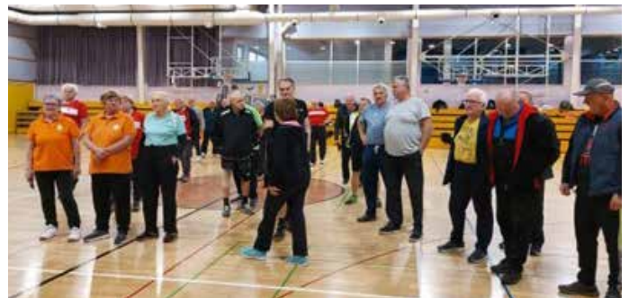
Tekmovalce je sodnik seznanil s pravili igre