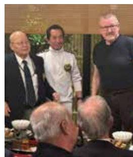
Mimoto, Masa & Anton Japonska 2026