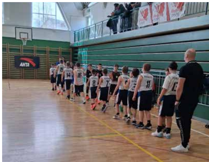
Pred tekmo za bronasto odličje