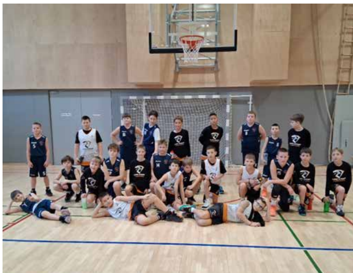
Po tekmi s Kranjčani

Sicer v letošnji sezoni delujejo štiri ekipe od u-9 do u-12, ki se udeležujejo tekmovanj na različnih ravneh (SKL, turnirji, prijateljske tekme).