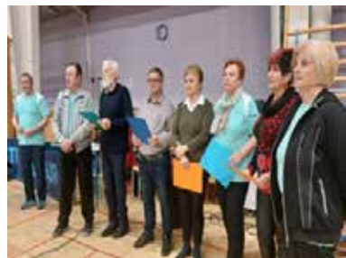
Pevski zbor DU Petrovče

Na otvoritvah tekmovanj je prisotne športnike, goste in gledalce pozdravila predsednica društva, pri regijskih tekmovanjih je pevski sestav DU Petrovče zapel občinsko himno Savinjska dolina, na državnem tekmovanju pa državno himno. Po predstavitvi protokola in pravil tekmovanja so tekmovalci začeli s tekmovanjem.