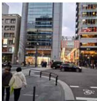
Nakupovalna ulica Shinsiabashi-suji v Osaki