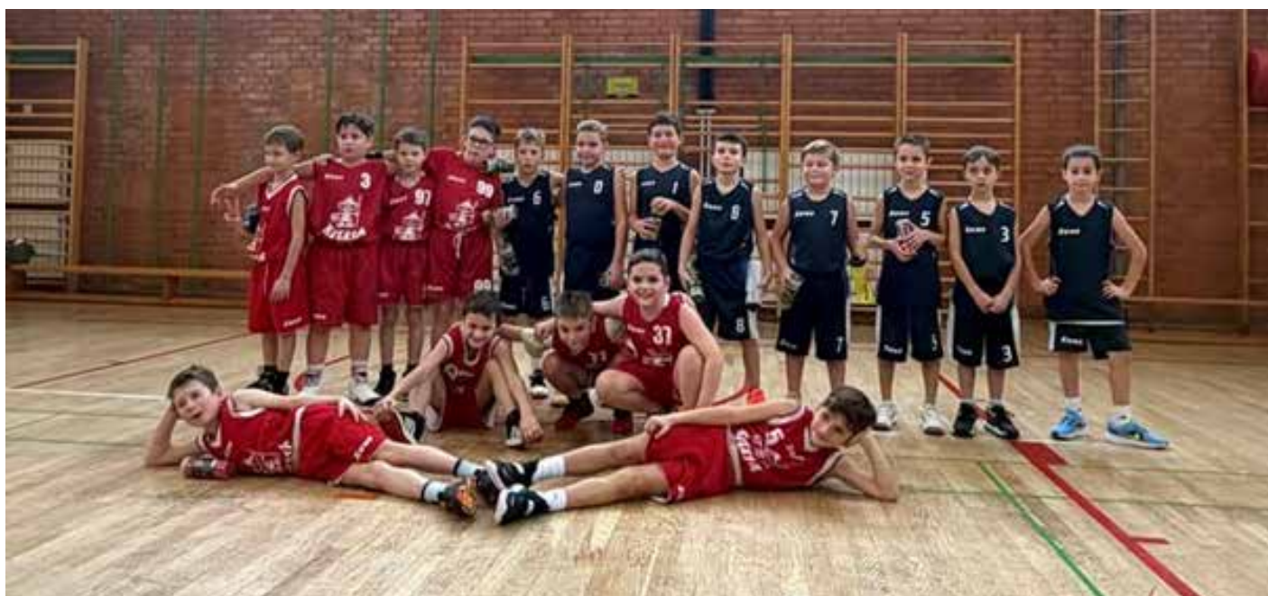
Ekipa u-9 po tekmi v Celju (modri dresi)