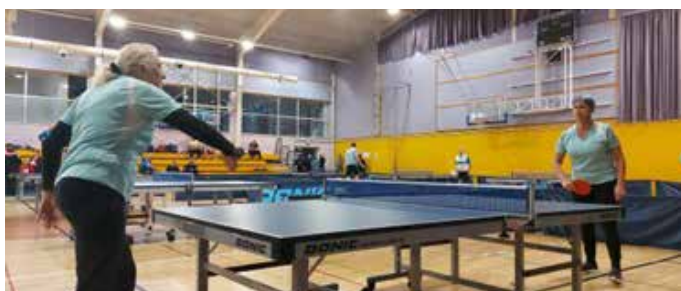
Ženske in moški posamezno