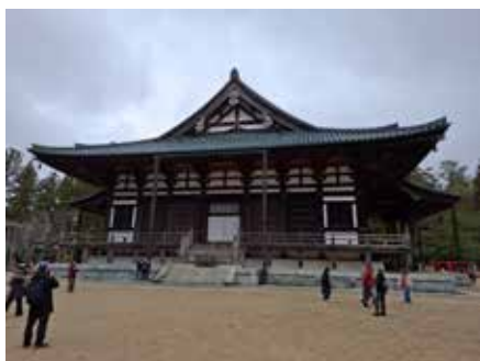
Tempelj Kon-do v Koyasanu