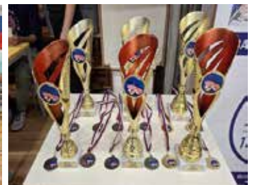
Pokali in medalje čakajo na podelitev