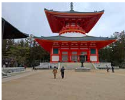
Pagoda Konpon Daito v Koyasanu