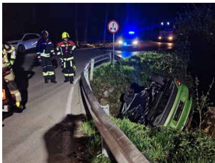
Gasilca Matjaž in Joži ponoči na prometni nesreči